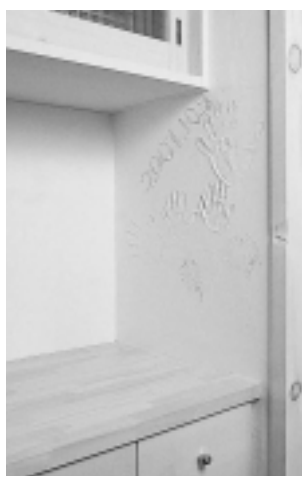
珪藻土で仕上げられたキッチンの壁には、家を建てた記念に家族全員の手型が残っている。

ホーロー製のキッチンやユニットバスは、プラスチック樹脂や化粧合板の有害物質対策として。 温水暖房の配管は高耐久架橋ポリエチレン管。給水管にはステンレス配管を使い分けて使用。 合板類のホルマリン対策や接着剤の健康対応は、今では常識。