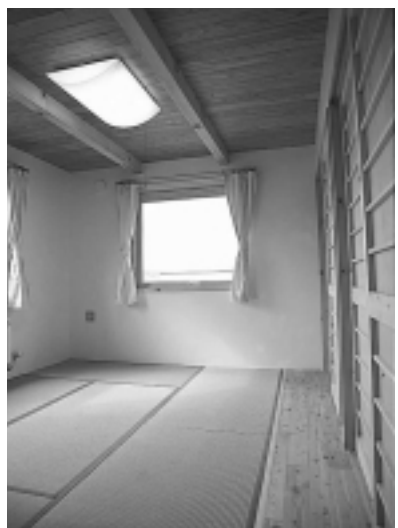
和室には健康畳を使用。

土台はヒバの芯持ち材を使用し、有害な薬剤の使用を避ける。 木材保護剤として炭からつくった建築用木酢液を使用。 畳は防虫紙を使わず、炭化コルクと有機栽培のイ草でサンドした健康畳。