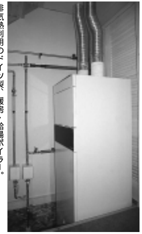
排気熱利用のドイツ製 暖房・給湯ボイラ。

木製3重ガラスの高断熱窓。 24時間換気の排気熱を利用したヒートポンプ、セントラル換気給湯システムと温水暖房(平成13年度NEDOの高効率エネルギーシステム導入促進事業の補助金を受けている)。 コンセントの手動スイッチで待機電力をカット。家電製品からの電磁波対策としても有効だったりして…。キッチン廻りは電磁波発生源がいっぱい。 過敏体質の家庭なので電磁波の心配なIH型電磁調理器の使用を避ける。