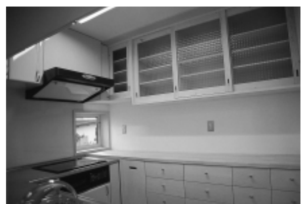
キッチンにはホーロー製を使い、収納棚などは無垢材で造作した。

4寸の角柱と5寸の中柱、木組みの梁を現した木造構造の家。 床板・天井板は道産イタヤカエデ、カラマツ、東北産のアカマツなど国産無垢材を使用。アカマツ材を1本1本手づくりで組み上げた無垢の建具。 壁紙は余分な化学処理を排除した四国の和紙と、ドイツの木チップクロスが無添加のりで施工。 吸放湿に優れた珪藻土を洗面所・台所などの湿気対策として使用。 土の良さを残した素焼きのテラコッタタイルを玄関廻りの壁や床に。 水廻りの床は耐水性のあるコルクタイルを蜜ロウワックスで仕上げ、天然系無添加のりで施工。 木廻りの塗装はドイツ・リボス社の自然塗料、植物系塗料と、水性の蜜ロウワックスで仕上げる。