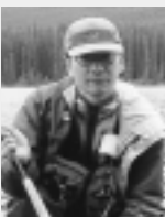
一級建築士事務所 (有)西條インテリア 代表取締役