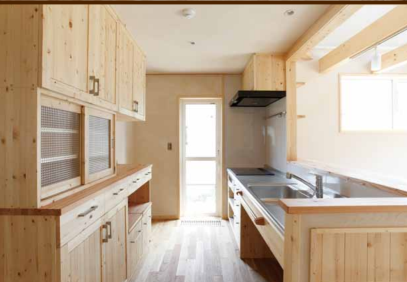
道産材でつくるオーダーキッチン。