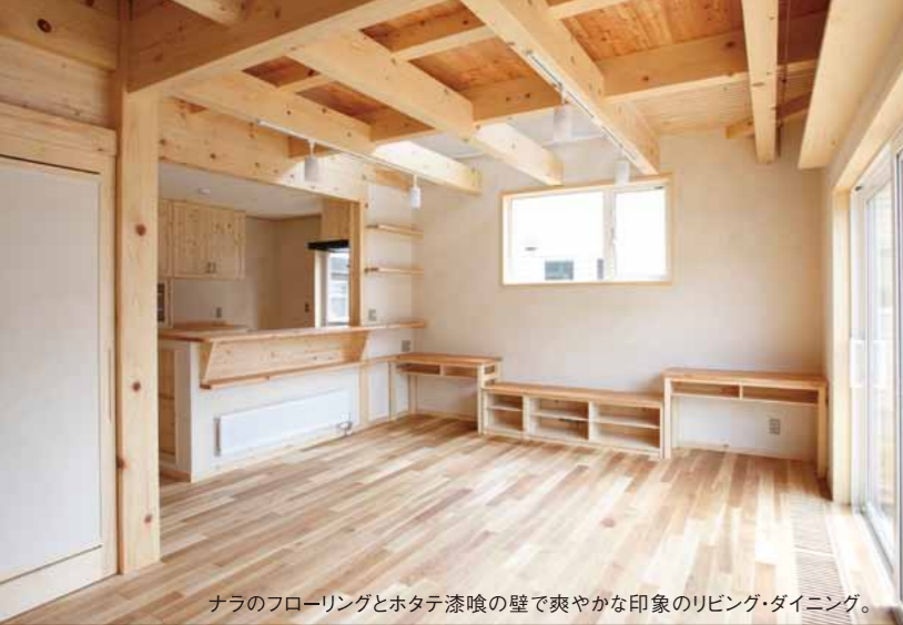
ナラのフローリングとホタテ漆喰の壁で爽やかな印象のリビング・ダイニング。