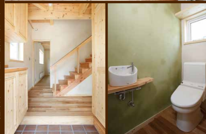
トイレの壁の漆喰をベンガラで調色。