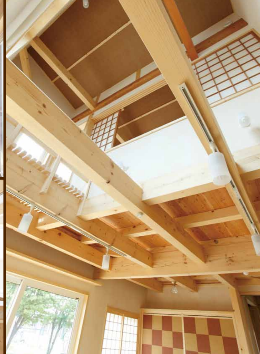
木組みが特徴的な天井と吹抜け部分。