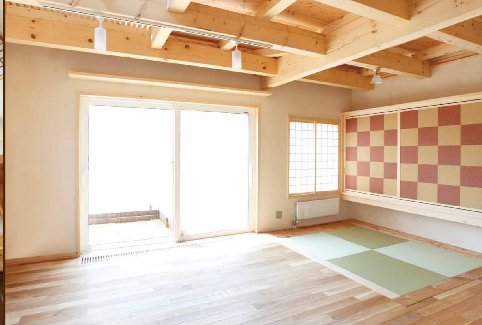
合板を使わずに無垢の木だけにこだわった、2帖の小さな畳コーナーのあるリビング。