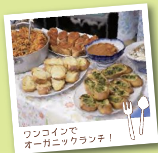
ワンコインで オーガニックランチ！

オーガニックとは「有機的な」「本質的な」という意味があります。 オーガニックカレッジは、衣・食・住の本質を学ぶ場として7年目をむかえます。