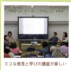
エコな発見と学びの講座が楽しい