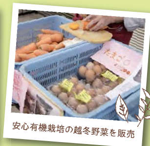
安心有機栽培の越冬野菜を販売