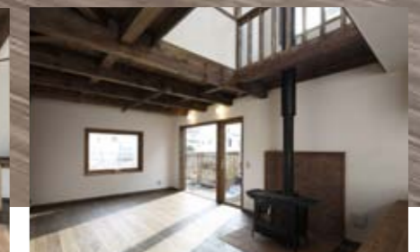
左／ガラス戸から直接庭へ出入りできる。畑をつくるのが楽しみ。 右／吹き抜けで2階とのコミュニケーションもスムーズだ。