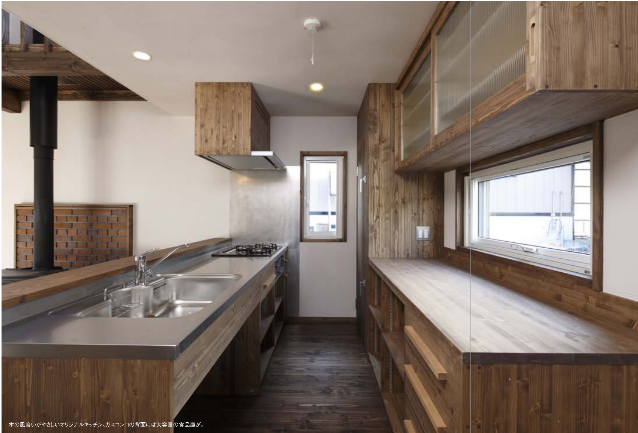
木の風合いがやさしいオリジナルキッチン。ガスコンロの背面には大容量の食品庫が。

天板のステンレス以外はすべて道産トドマツで仕上げたオーダーキッチンも、西條デザインらしさのひとつ。キッチンは日常的にもっとも使用頻度が高く、衛生的で機能的、かつ安全性が求められる場所だ。無垢の木に植物油の天然塗料で仕上げた面材は有害物質を発生させることなく、質感もやわらか。食器や家電がおさまるたっぷりの収納と、外気を取り入れ低温をキープする食品庫を備え、使い勝手も抜群。なにより、そこに立つのがうれくなるデザインである。昼食など一人の食事は対面カウンターで手軽に、というのも快適だ。キッチン以外に好きな場所はと尋ねると、迷わず吹き抜けとの答えが返ってきた。「家じゅう