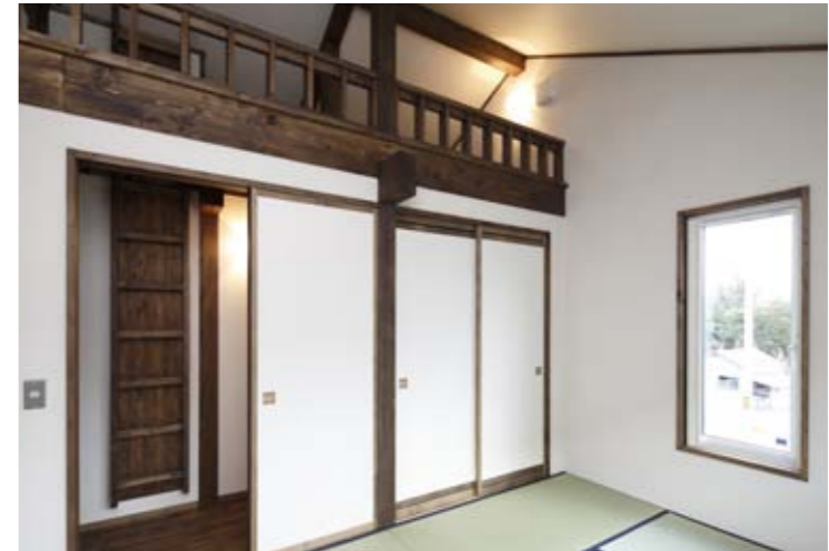
上／現在フリースペースとして活用している2階ホールは、将来的に2室の子ども部屋にできるよう分割可能な設計に。 下／寝室は布団で寝る畳の間。天井の勾配を利用して設けたロフトは、父と子の秘密基地に。