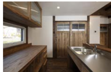
キッチンからの視界も良好。シンク左手の板戸を空ければ、浴室・脱衣所・洗濯スペースの水回りがひとまとめに。

家族の声が通るのが気に入っています。この家に住んでから思い切ってテレビを止めました。最初はどうかと思ったのですが、すぐに夫も子どもも慣れたようで。かえって絵本を呼んでとか、子どもとのコミュニケーションが増えたのもいいですね。」 もともとエコロジーへの関心が高かった奥さまだが、ここへ来てさらに磨きがかかる。なるべく電気を使わないように、掃除はできるだけホウキや雑巾を活用しているとのこと。北海道の木でできた手づくり感あふれる住まいを、自分で大切に手入れしたいと思うのは、ごく自然なことなのではないだろうか。