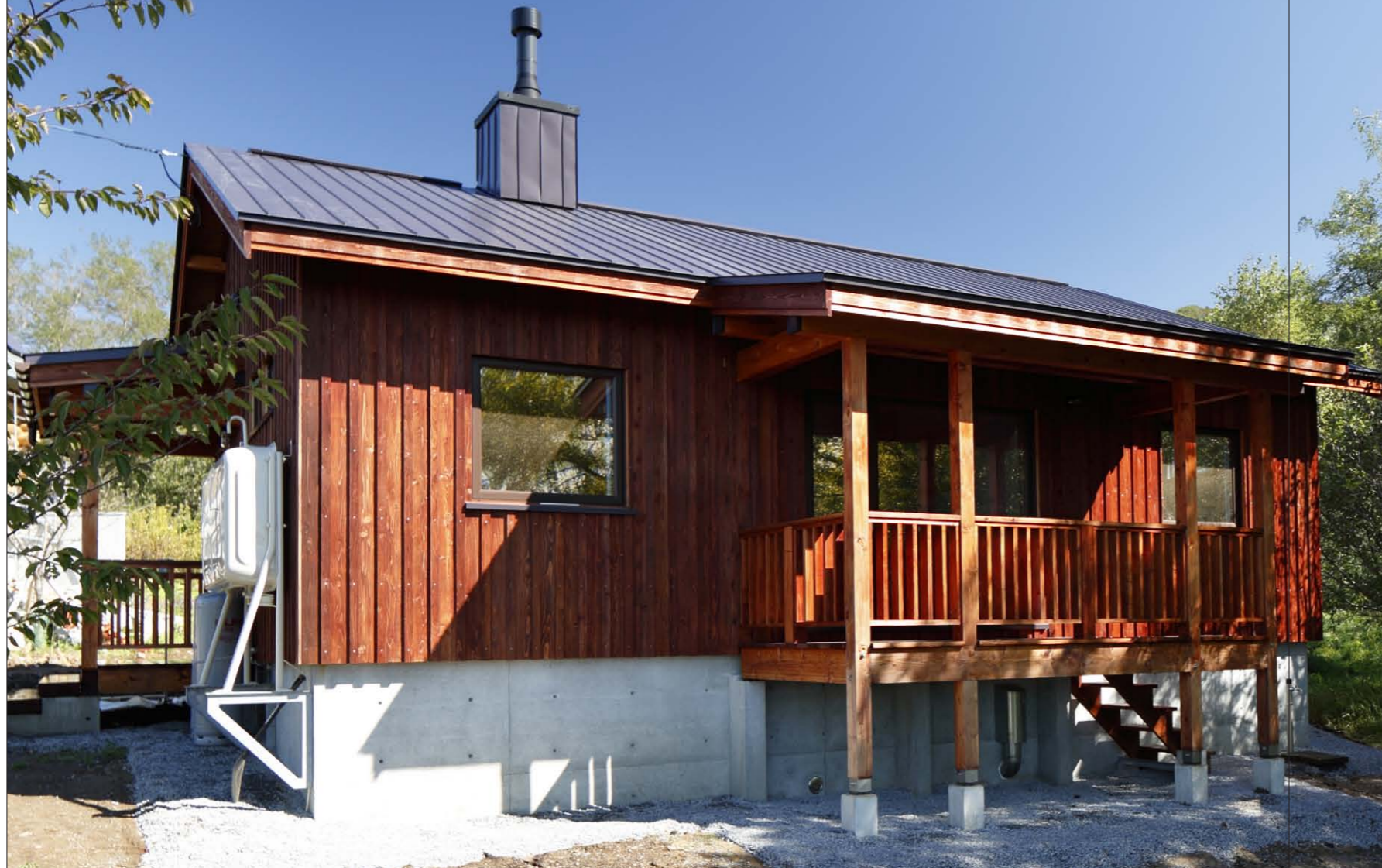
コンパクトな切妻屋根の平屋の住まいは道産杉の板壁仕上りが似合います。柿波塗装を施主さんがセルフビルドで仕上げました。