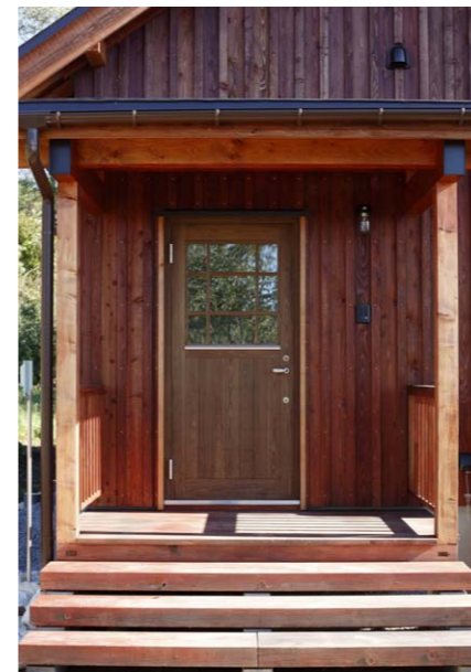
左/木製断熱玄関ドアとウッドデッキの玄関ポーチ。 右/ひさしの伸びた南側バルコニーはサマーリビングとして。