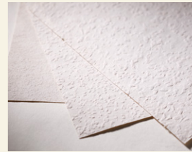
ドイツ製ウッドチップ入り紙壁紙