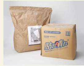
防カビ剤無添加のバテ下地材と天然糊