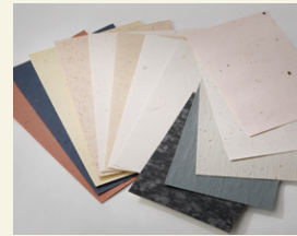
土佐和紙と撥水効果のある紙壁紙