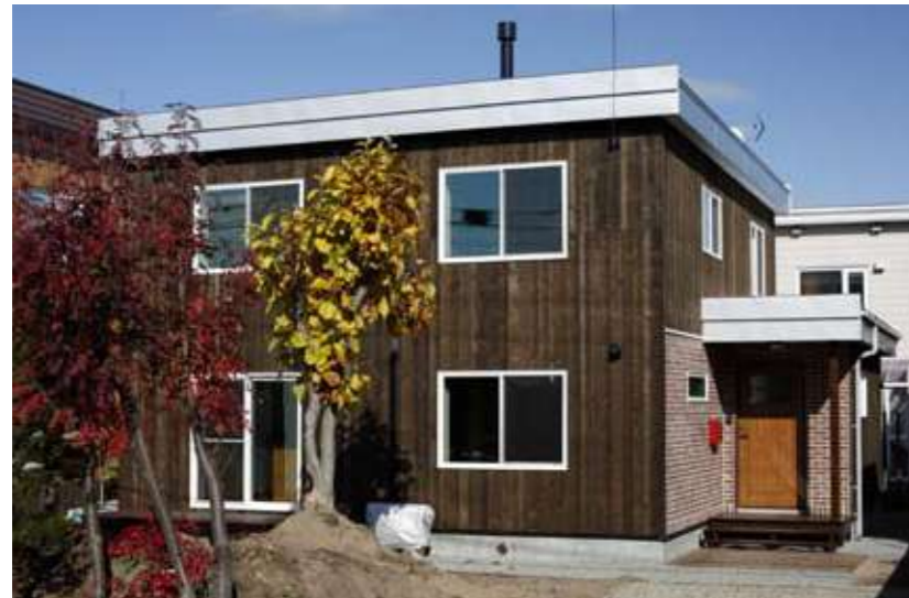
コンクリート住宅が木の温もりあふれる住まいに変身。躯体は生かし、玄関の位置や間取りの変更で家族のライフスタイルに合った住まいに。

フルリノベーションで大変身！築38年のコンクリート住宅が、道産材をたっぷり使った自然派住宅へ。