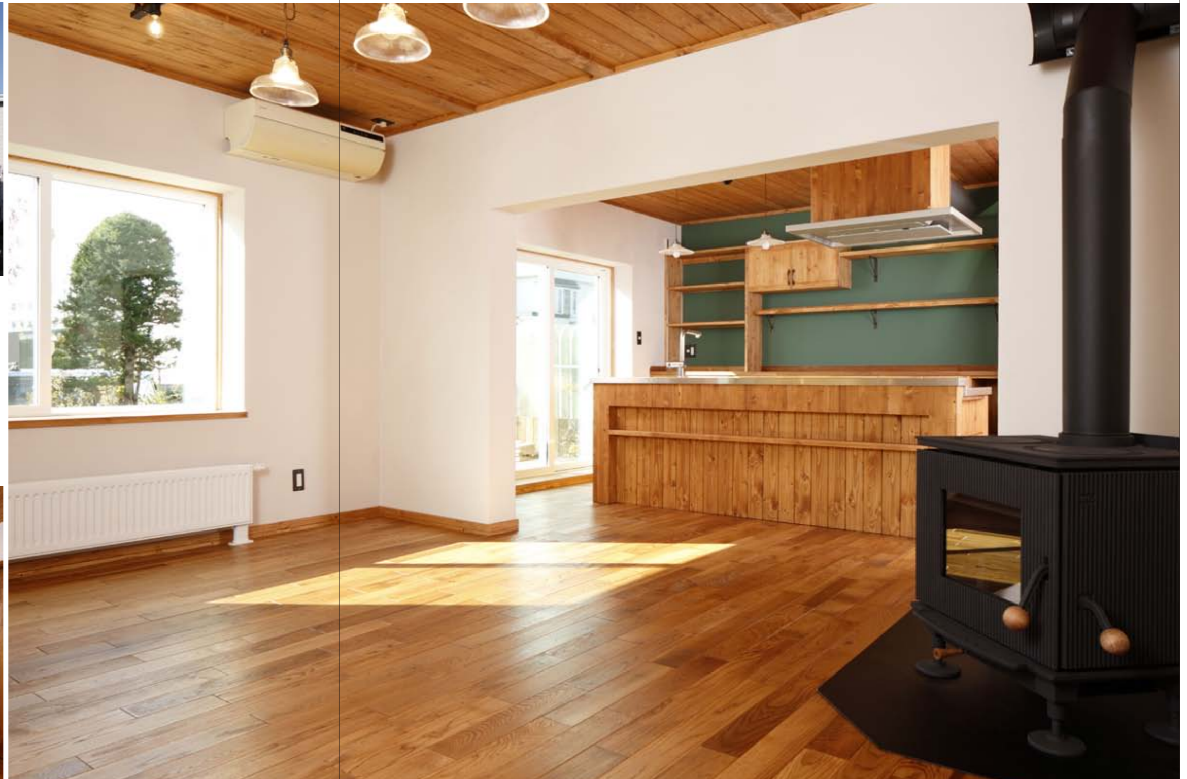
北海道産の無垢の木と帆立貝の漆喰で仕上げたナチュラルなインテリア。 床は元のコンクリートの上に厚さ20mmの木質断熱ボードを敷き、その上にミズナラフローリングを施工。

南に面した前庭の樹木と響き合うように、道産カラマツの外壁があたたかみのある雰囲気を出す。一見すると新築そのものであるが、元はといえば、昭和50年代に建てられたコンクリートパネルによる住宅だ。外観をはじめ、内装のフルリノベーションにより生まれ変わった住まいは木の香りあふれ、なんとも心地よい。空気まできれいに感じられる。オーナーはご夫婦と小学生の長男の3人家族。ビオプラス西條デザインとの出会いは、知人が同社で建てた住まいを