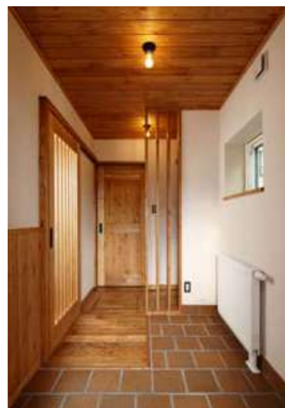
左／江別産テラコッタレンガを敷いた玄関ホール。自然素材ならではのやさしい空間。 右／リビングの一角に奥さまのワークコーナー。デスクや吊戸棚も使い勝手に応じて造作。