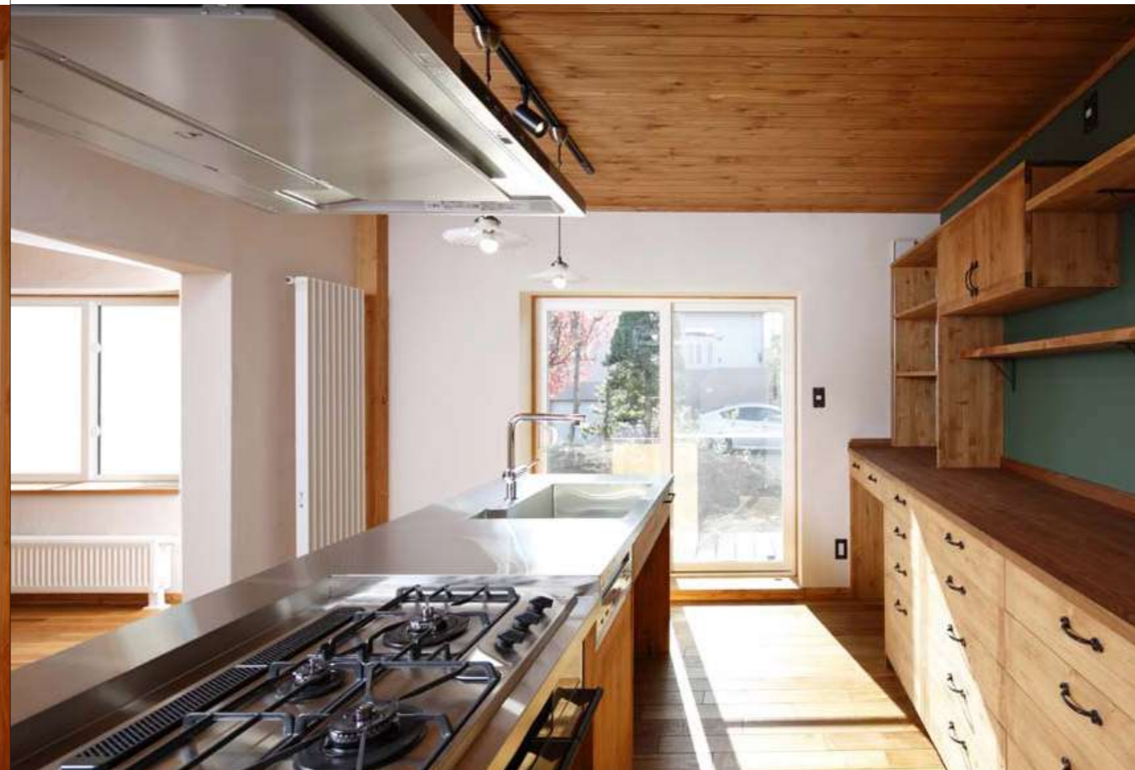
背面のキャビネットは収納部分に黒い鉄の取っ手をつけ、ちょっとクラシックな印象に。