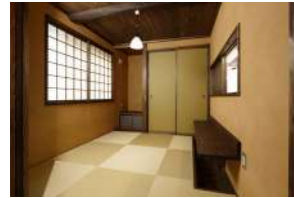
土壁風仕上げと縁なし畳みの小上がり和室は落ち着いた空間に