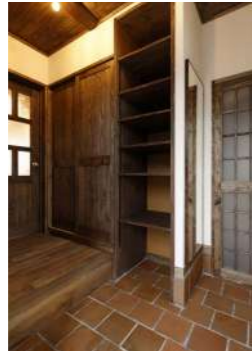
江別産テラコッタタイルの玄関土間が標準仕様