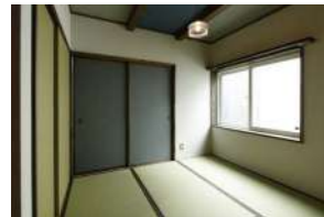
寝室の和室の壁と天井と建具は全て越前和紙で落ち着いた仕上がりに