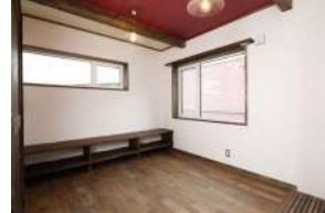
日当たり満点の2階に造作したセカンドリビング