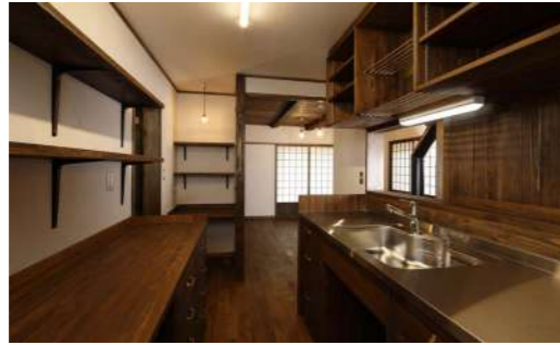
道産カラマツで作った木製キッチンがフルオーダーで自由自在。シンク前の引き戸を開けると小上がりにつながる対面仕様