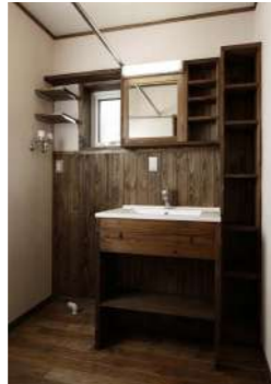
リネン棚と洗面カウンターも道産木で使い勝手良くオーダー製作